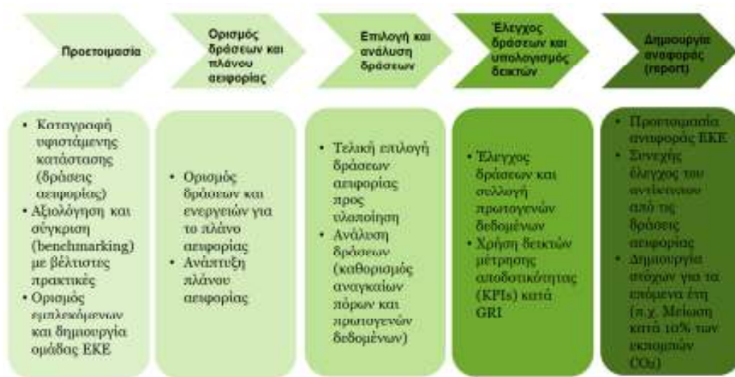
Σχήμα 2. Μεθοδολογία και βήματα για την έκδοση απολογισμού ΕΚΕ

Η μεθοδολογία που πρέπει να ακολουθηθεί περιλαμβάνει μια σειρά από βήματα τα οποία παρουσιάζονται αναλυτικά στο Σχήμα 2. Το σημαντικότερο για την επιτυχία όλης της διαδικασίας αποτελεί η ύπαρξη αντίστοιχης κουλτούρας από τα διοικητικά στελέχη της εταιρίας. Μάλιστα, επειδή η διαδικασία αυτή είναι δύσκολη και απαιτεί την εμπλοκή σχεδόν όλων των τμημάτων/διευθύνσεων μιας εταιρίας, είναι απαραίτητη η δημιουργία ομάδας ΕΚΕ που θα απαρτίζεται από στελέχη της διοίκησης. Τέλος, είναι σημαντικό κάθε εταιρία μετά την έκδοση ενός απολογισμού ΕΚΕ να θέτει στόχους (π.χ. μείωση του ανθρακικού αποτυπώματος κατά 10%) για συνεχή βελτίωση τα επόμενα έτη.